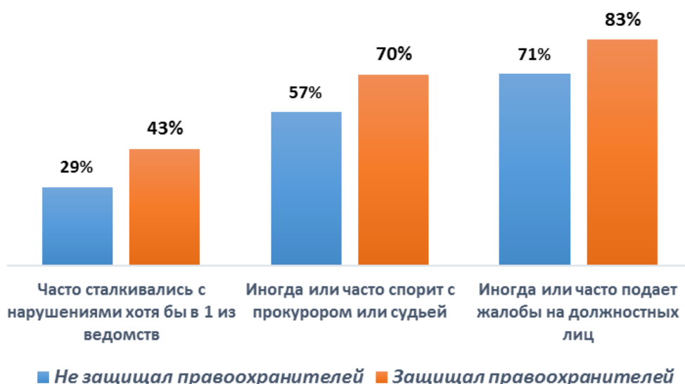
Таблица 3. Индикаторы противостояния адвоката с правоохранителями в зависимости от наличия у него опыта работы защиты правоохранителей.

Таким образом, можно предположить, что правоохранители в качестве защитников выбирают тех адвокатов, которые не вступают в кооперацию с правоохранителями. Интересно, что для правоохранителей при выполнении служебных обязанностей именно такие, «рьяные» адвокаты являются наиболее неприятными контрагентами [Ходжаева,