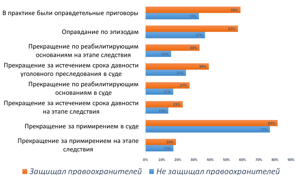
Таблица 4. Результативность адвоката в зависимости от наличия у него опыта работы защиты правоохранителей.

Из графика видно, что адвокаты с опытом защиты правоохранителей более эффективны по всем параметрам (однако различия по примирению в суде и на этапе следствия менее значимы). У 59% адвокатов, защищавших правоохранителей, были оправдательные приговоры (среди тех, кто не имеет этого опыта, лишь 33%). Они чаще достигали таких результатов как оправдание по эпизоду, прекращение дела по реабилитирующим основаниям на суде и на следствии, прекращение дела за истечением срока давности.