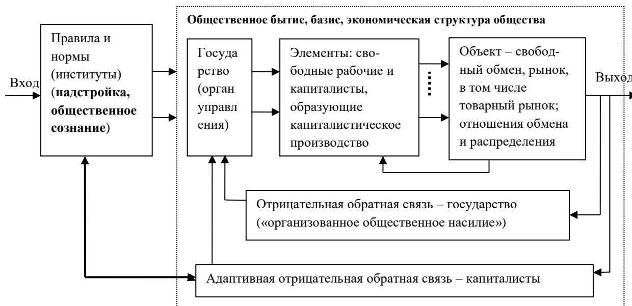
Рис. 1. Модель капиталистической экономики по Марксу с позиций общего системного подхода

На рис. 1 с позиций общего системного подхода представлена структурно-функциональная модель капиталистической экономики, соответствующая теории К. Маркса.